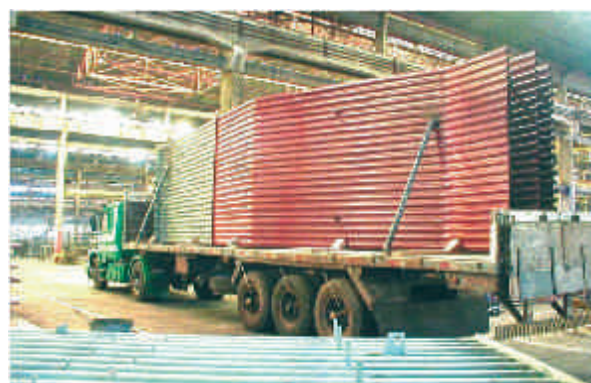
Transporte dos painéis